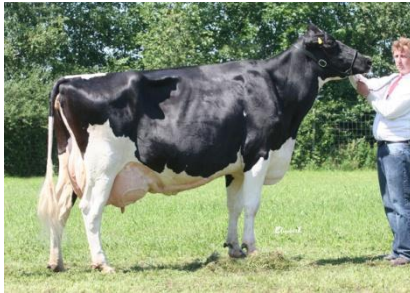
Annelund Rudolph Roxette EX90

Dec 2010 var medelpoäng för Kropp 83,5 , juver 81,8 , ben 82,1 och för helhet 82,4 För det mesta finns livdjur, tjurar och embryon till salu.