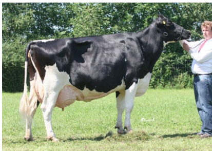
Annelund Rudolph Roxette EX90

Dec 2008 var medelpoäng för Kropp 83,3 , juver 81,3 , ben 81,5 och för helhet 81,9 För det mesta finns livdjur, tjurar och embryon till salu.